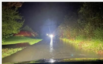
Der var meget vand på asfaltvejen i november