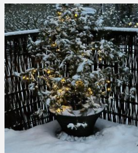
Sne og juletræ i Pøt – dejlig julestemning

Stierne i området er gået efter, og er blevet repareret her i efteråret. Vejene er i god stand, så her er der kun lappet huller, og så ser vi til foråret om en renovering med nyt granitlag er nødvendig.