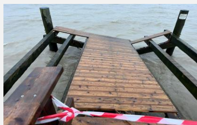
Broen beskadiget og spærret af.